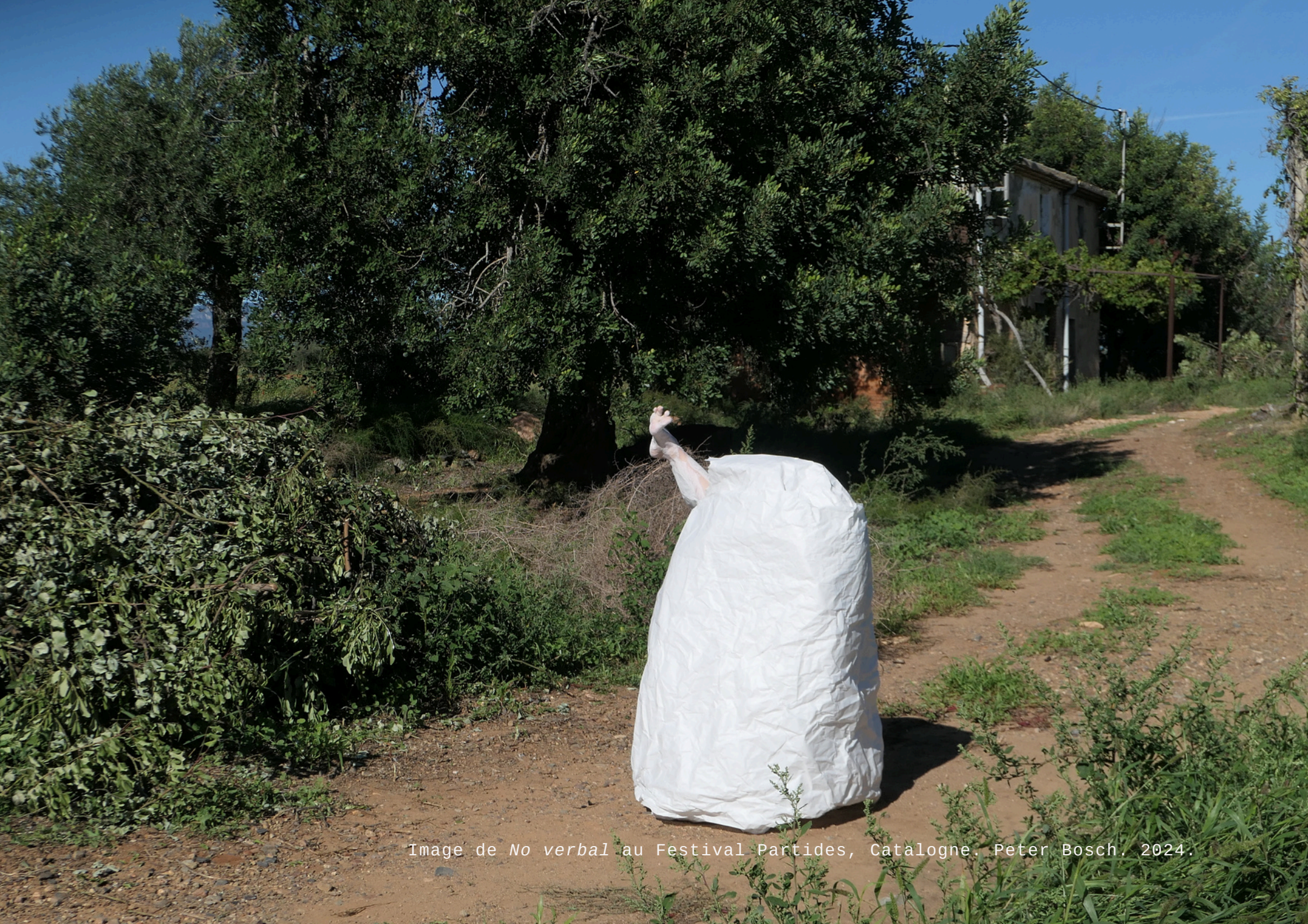
Image de No verbal au Festival Partides, Catalogne. Peter Bosch. 2024.