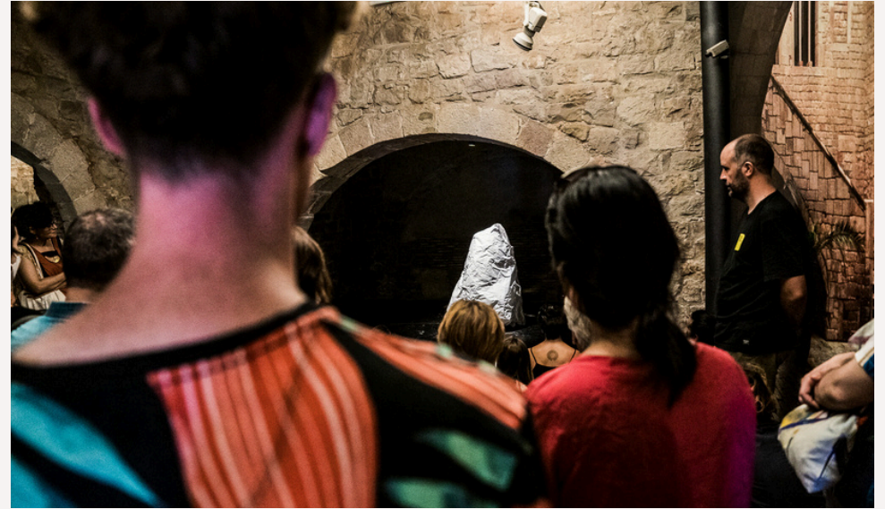
Images de No verbal au Musée Picasso de Barcelone.