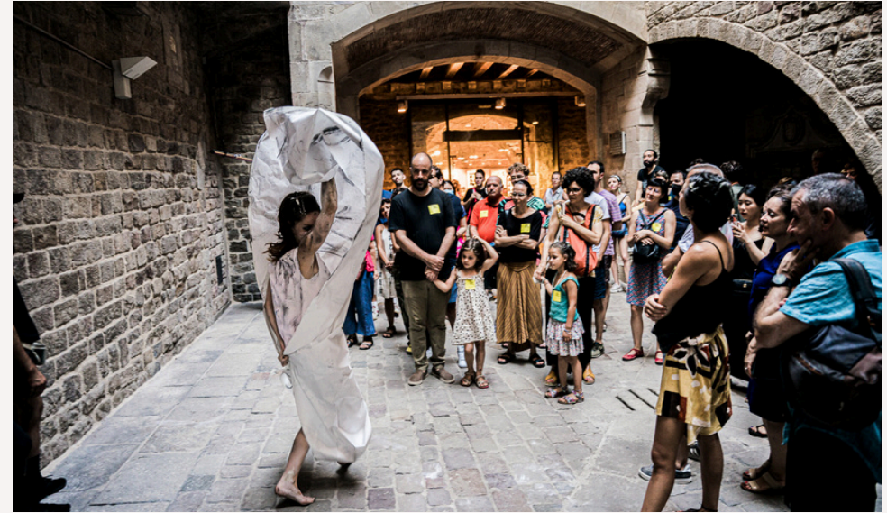
Images de No verbal au Musée Picasso de Barcelone.