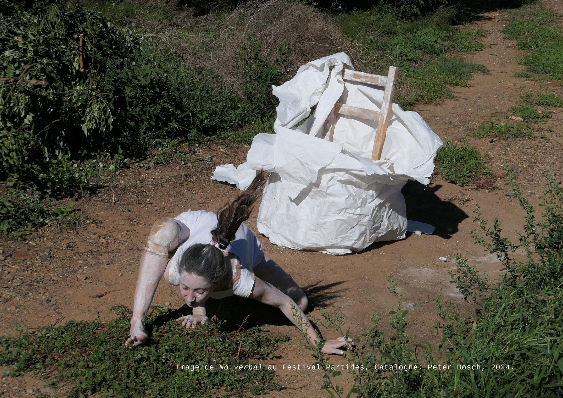
Image de No verbal au Festival Partides, Catalogne. Peter Bosch, 2024.